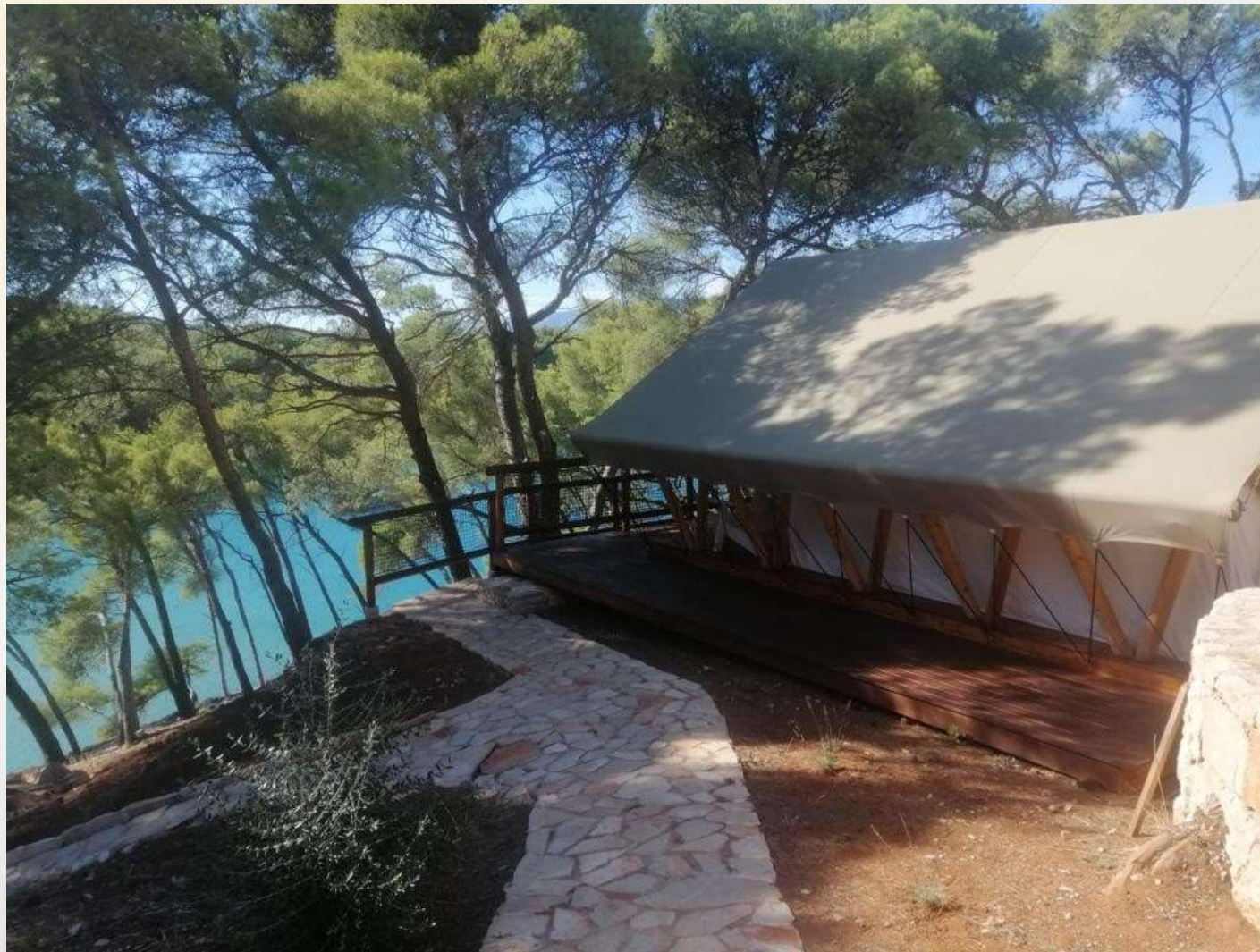
OSTAJEMO ZAJEDNO - WE STAY TOGETHER