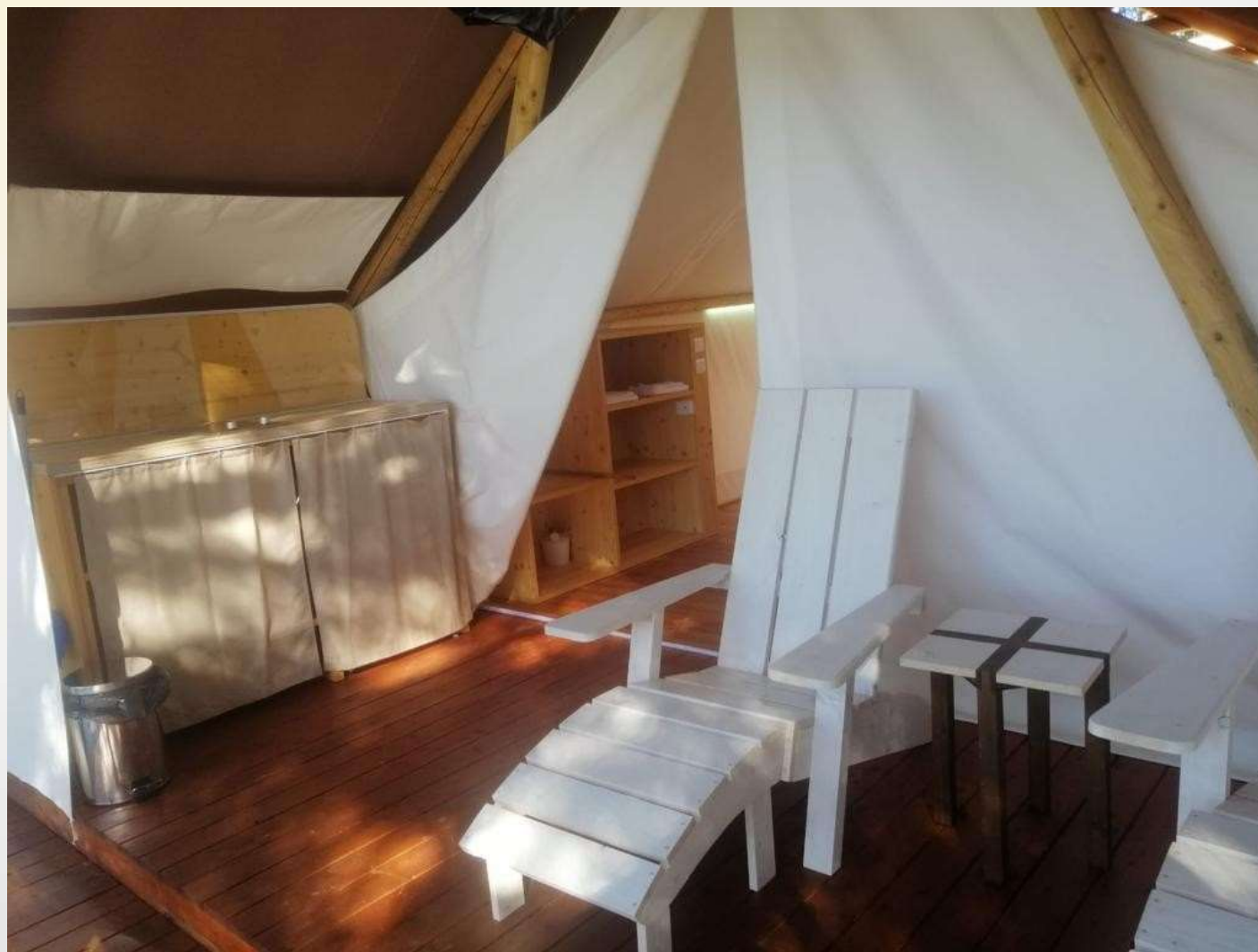
OSTAJEMO ZAJEDNO - WE STAY TOGETHER