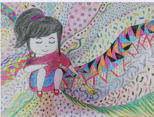
Radovi učenika Osnovnih škola u Republici Hrvatskoj prikazani u ovom promotivnom materijalu.